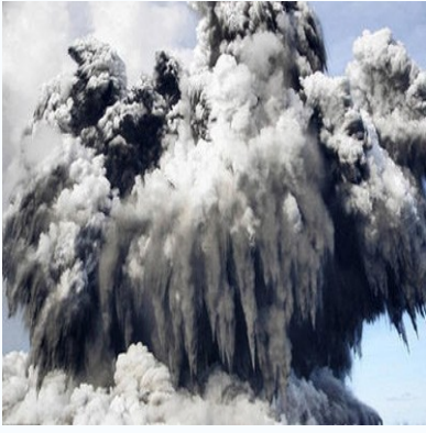
cenusă și fum degajate de vulcanul islandez