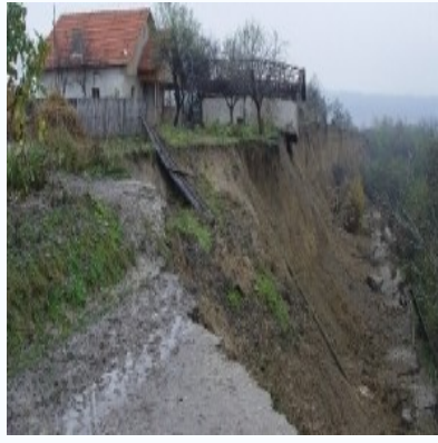
alunecări de teren Prahova