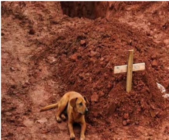
Alunecare de teren în Brazilia-ianuarie 2011- câinele nu se deslipește de mormântul stăpânei sale decedată în urma dezastrului