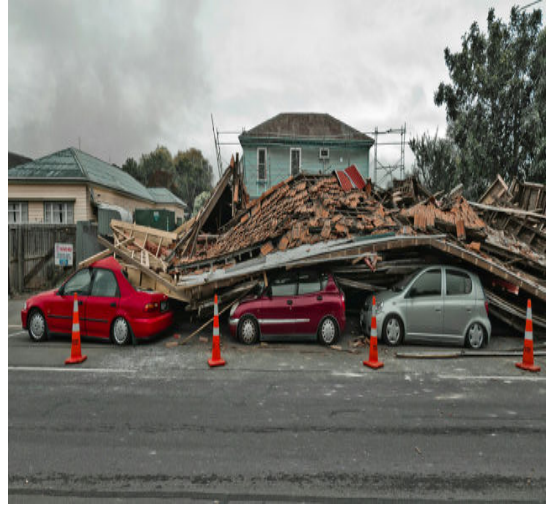
Cutremur Noua Zeelandă-februarie-2011