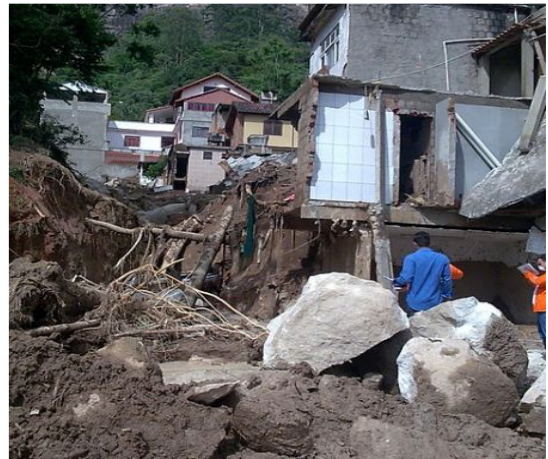
Alunecări de teren Brazilia-ianuarie 2011