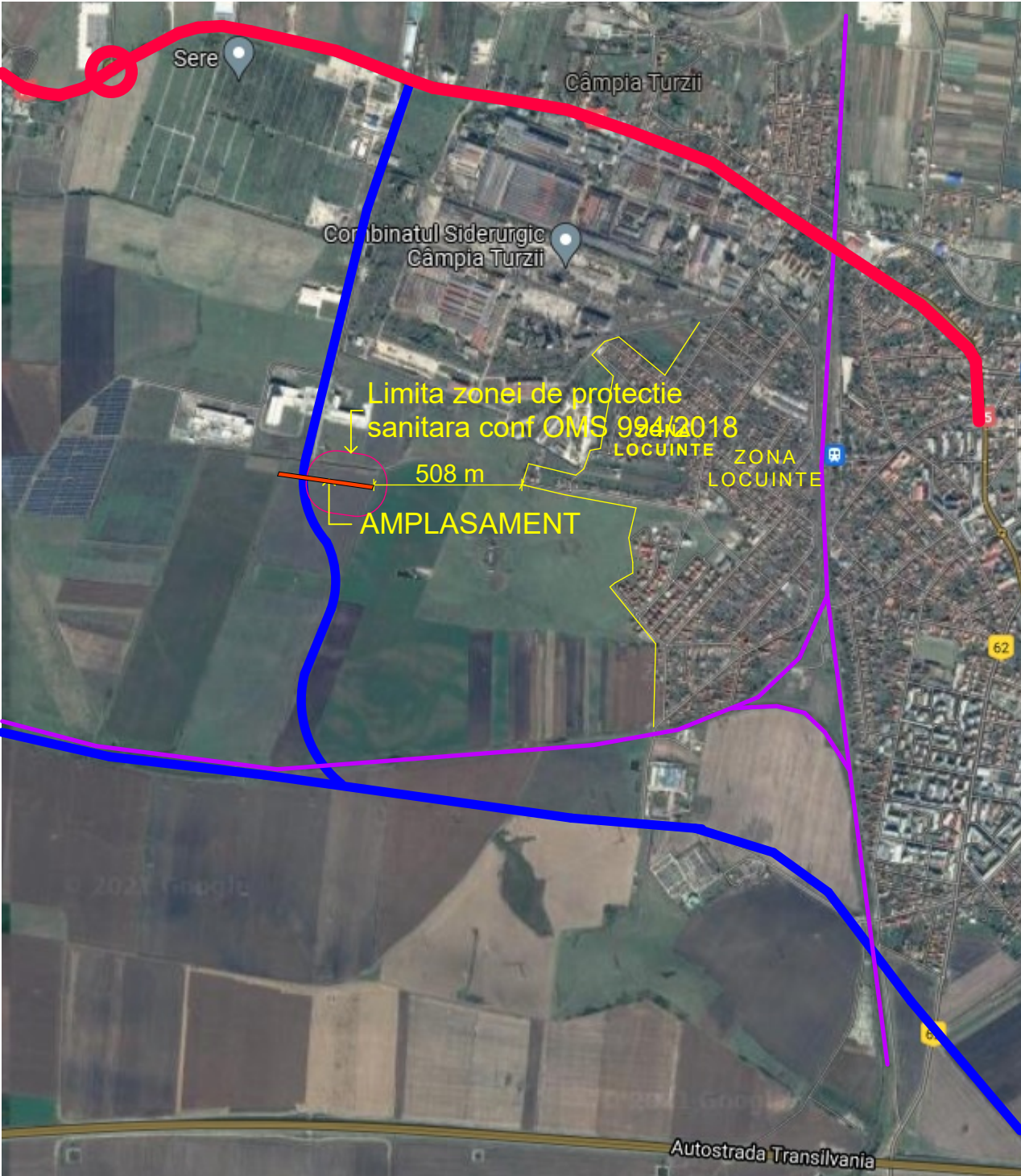
INCADRARE IN ZONA (maps)