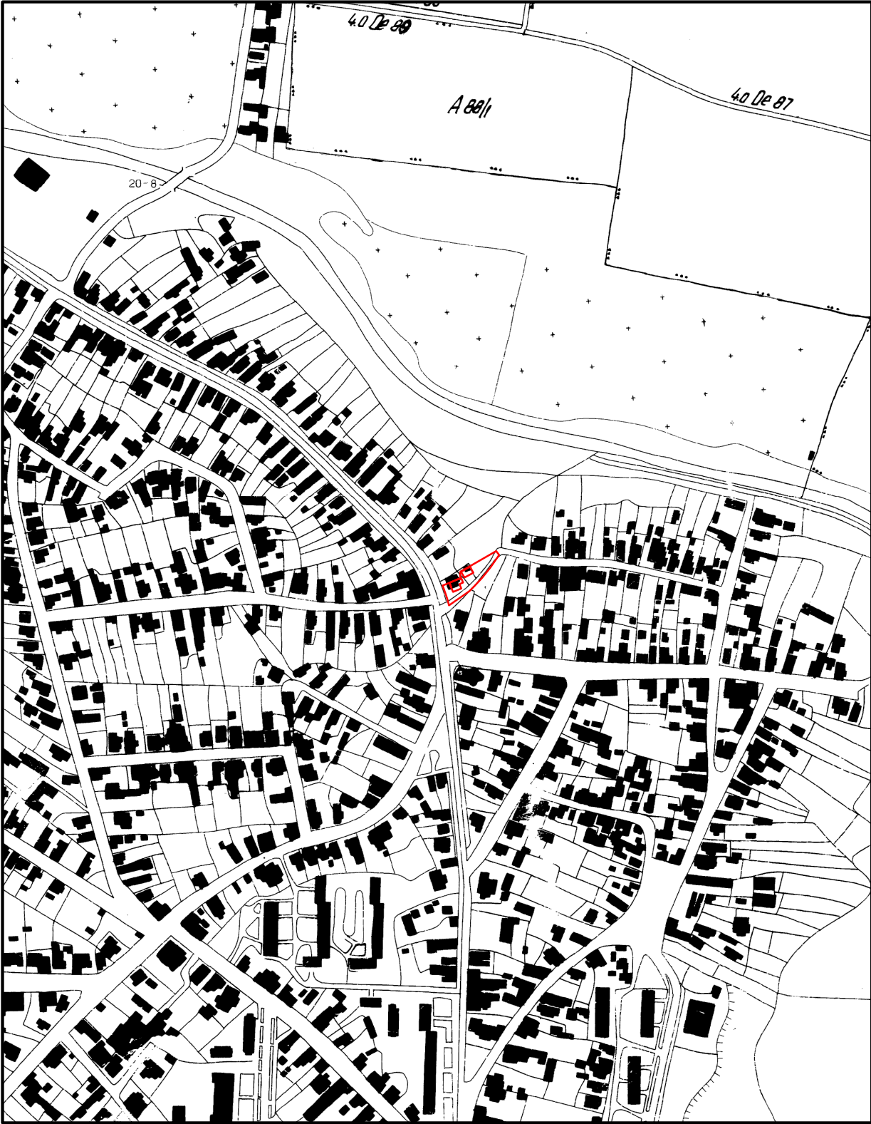
Plan de încadrare în zonă Scara 1:5000