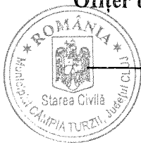
SUCIU NICOLETA ofițer stare civilă

Notă: Extrașul din declarația de căsătorie cuprinde, în mod obligatoriu: data afișării, datele de stare civilă ale viitorilor soți și, după caz, încuviințarea părinților sau a tutorelui, precum și înștiințarea că orice persoană poate face opoziție la căsătorie, în termen de 11 zile de la data afișării.